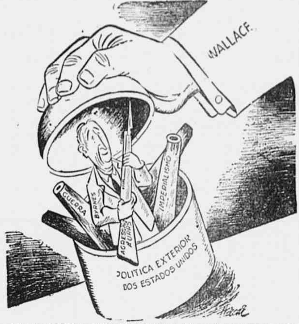
A intervenção de Wallace na política externa dos Estados Unidos serviu para desmascarar a orientação agressiva de Truman e Byrnes. É isso que Gropper, o grande escatologista, comenta na excelente "charge" ao alto, que tem toda a oportunidade em face das eleições de novembro ao Congresso norte-americano.

diversos em substituição a um sistema partidário da política de restauração internacional contra os partidos de linha expansionista da política exterior. DECLARAÇÃO CONTRADITÓRIA A marcha das campanhas eleitorais nos Estados Unidos tem-se movido, ultimamente, pre-